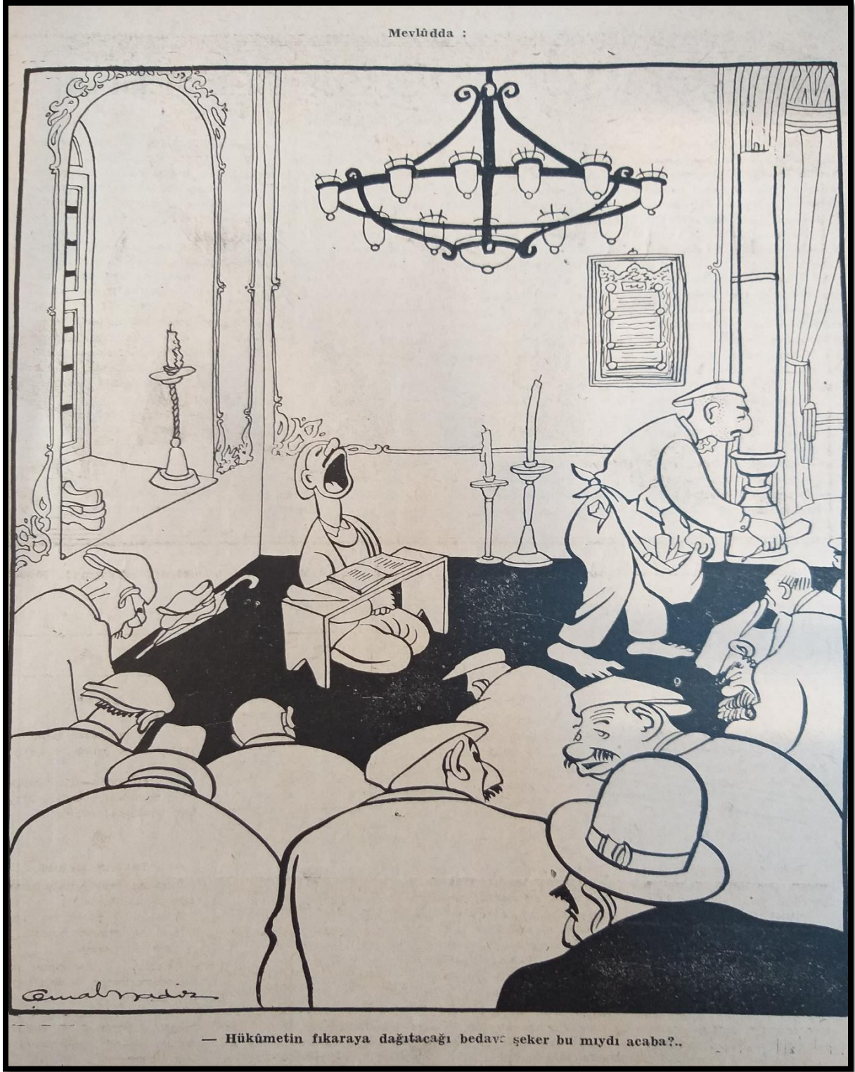
Şekil 1: Hükümet tarafından yoksul ailelere yapılacak olan şeker yardımının dönemin mizah dergisine yansması. 128